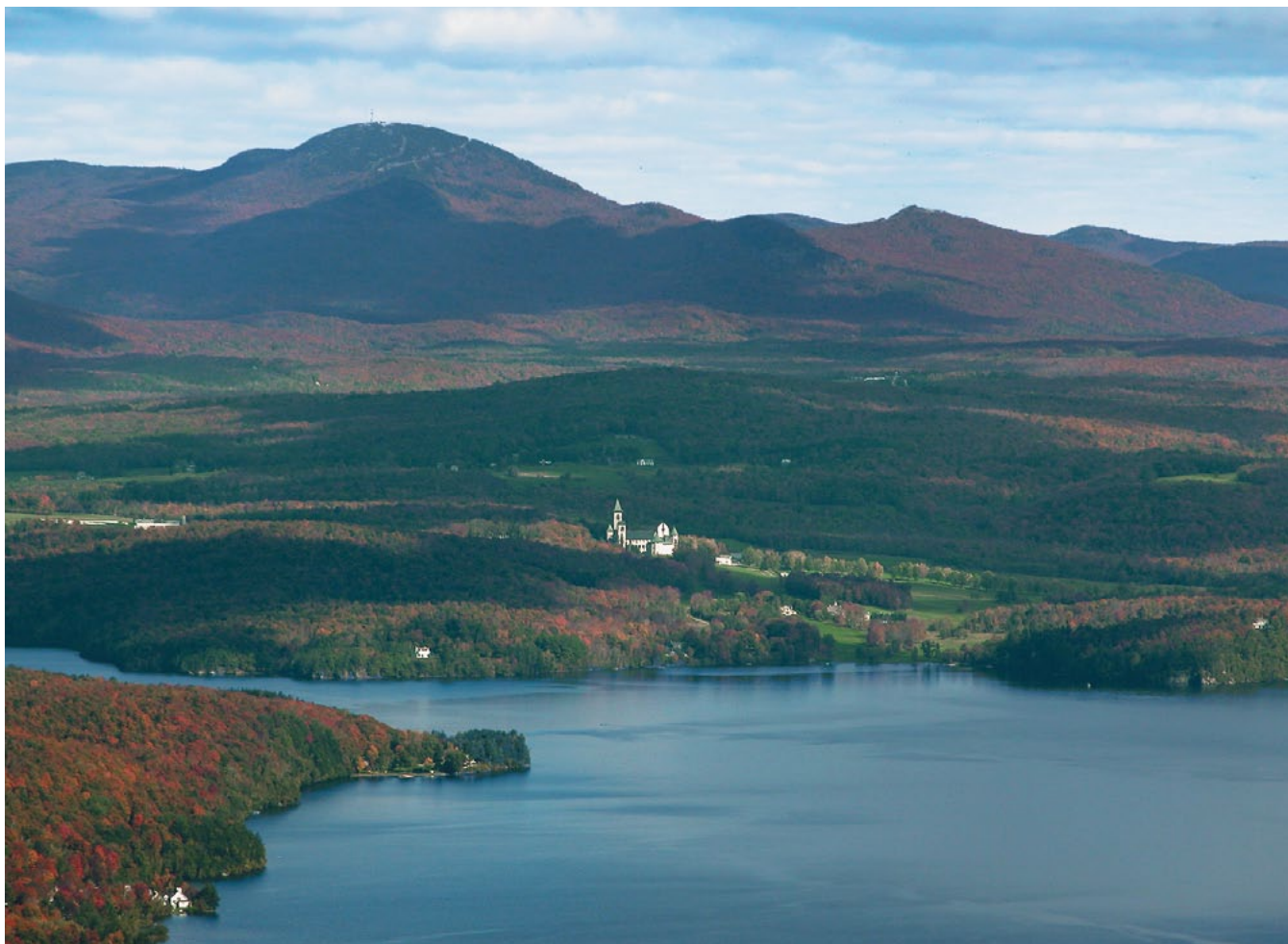
Vue du territoire, de la baie Austin jusqu'au mont Orford