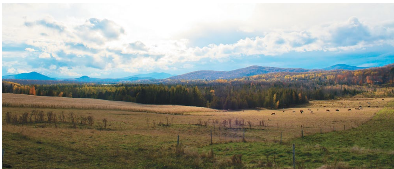
Vue du chemin Shuttleworth

Caractériser le patrimoine architectural et immobilier 2016 Protéger le patrimoine distinctif (ex : église, grange ronde, cimetières) 2017