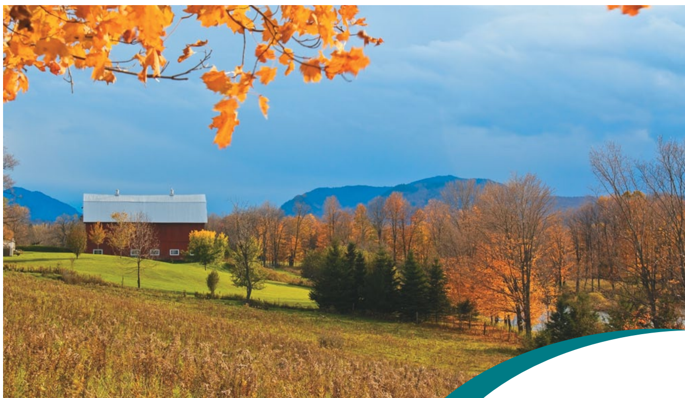
Vue sur le chemin Millington, photo : Mireille Dagenais