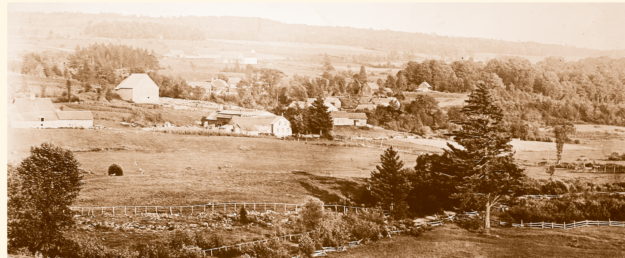
Le hameau Millington au début du XX e siècle