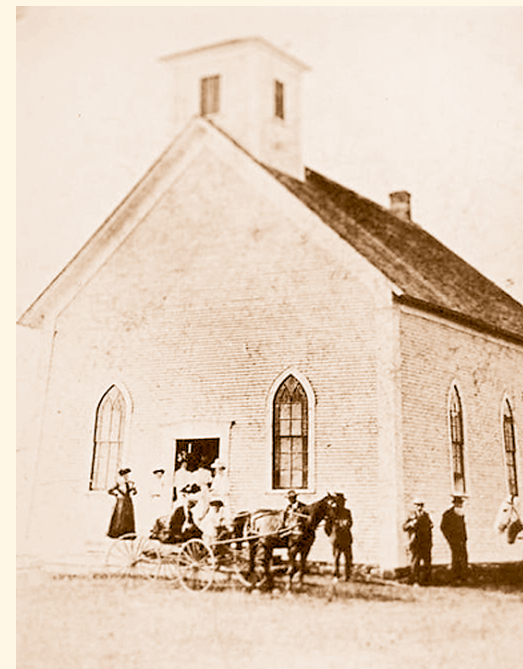
Église méthodiste Wesleyan

Le hameau connaît un essor, grâce à la construction de plusieurs infrastructures le long du ruisseau Powell par les premières familles colonisatrices du canton. En 1877, à l'ouverture du bureau de poste, le hameau est rebaptisé Millington . On y trouve alors un imposant moulin à grains en pierres actionné par une roue hydraulique (remplaçant le moulin à bois original