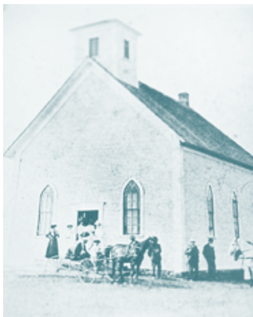
Église méthodiste Wesleyan