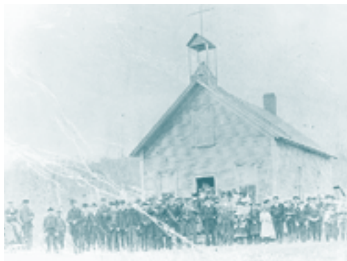
Église catholique Saint-Luc-de-Millington