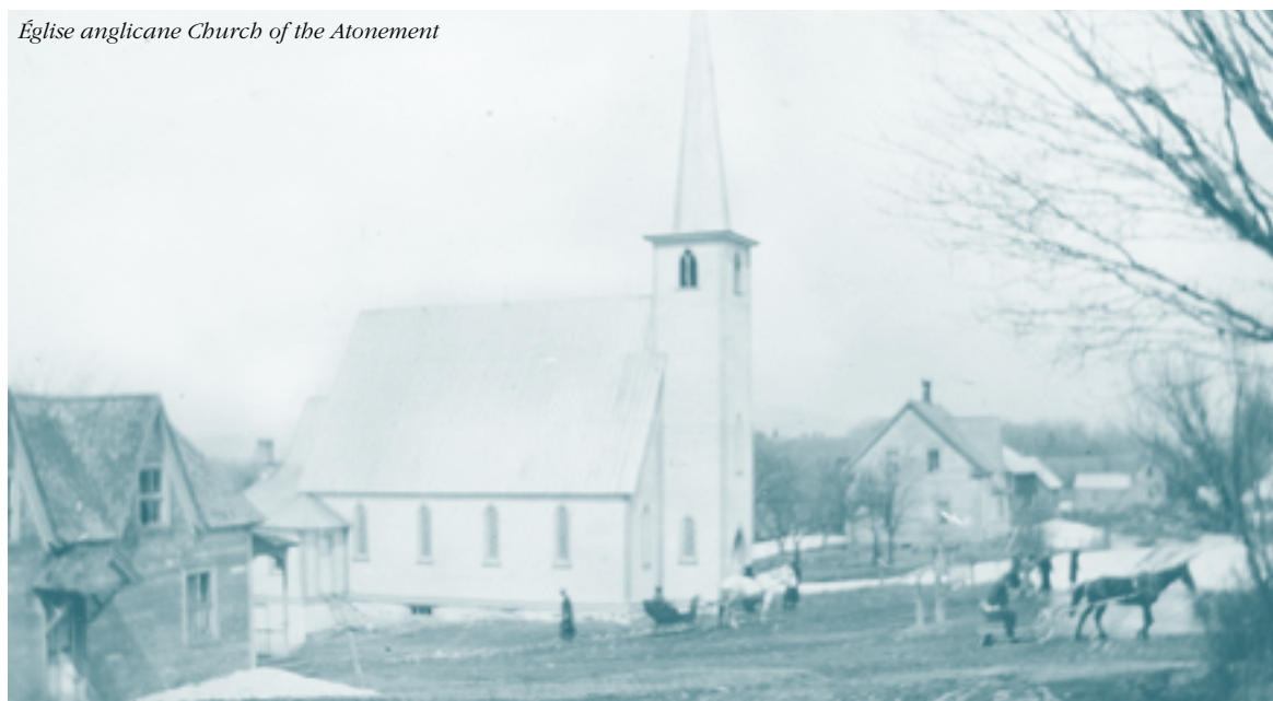
Église anglicane Church of the Atonement