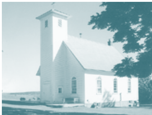
Église méthodiste New Connexion

La même année, le ministère de la Voirie veut élargir la route non loin de l'endroit où se trouve l'église. Parmi les fidèles, certains sont en faveur de la démolition du bâtiment,