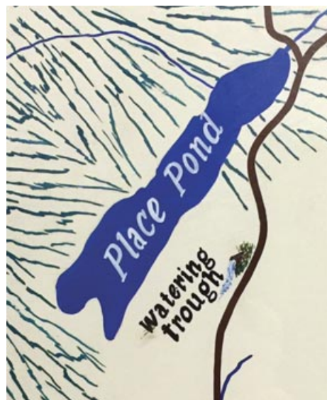
The spring is shown on the commemorative map of Austin, 1993. (Place Pond was renamed Lac Gilbert at one point)