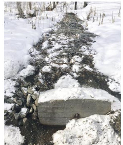
The spring fends off snowfalls as they try to smother it.