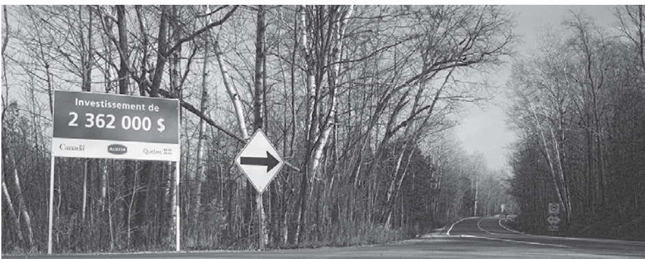
Chemin North, photo : Mathieu Godbout