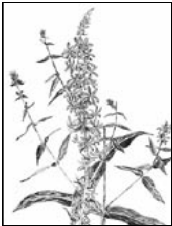
Illustration : Jeane Mary

Originnaire d'Europe et d'Asie, la salicaire pourpre a été introduite au Canada vers 1834. Elle était offerte dans le catalogue d'un marchand de graines montréalais pour être cultivée dans les jardins. C'est une plante extrêmement envahissante qui, n'ayant pas d'ennemi naturel en Amérique, étouffe et détruit les habitats marécageux et fauniques. Une seule plante peut se multiplier par milliers en quelques années à peine.