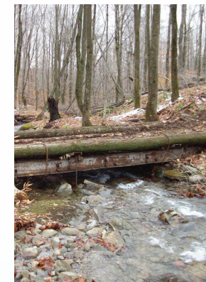
Une traverse de cours d'eau.